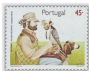
L'oiseau et l'homme