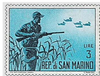
Dangers et ennemis